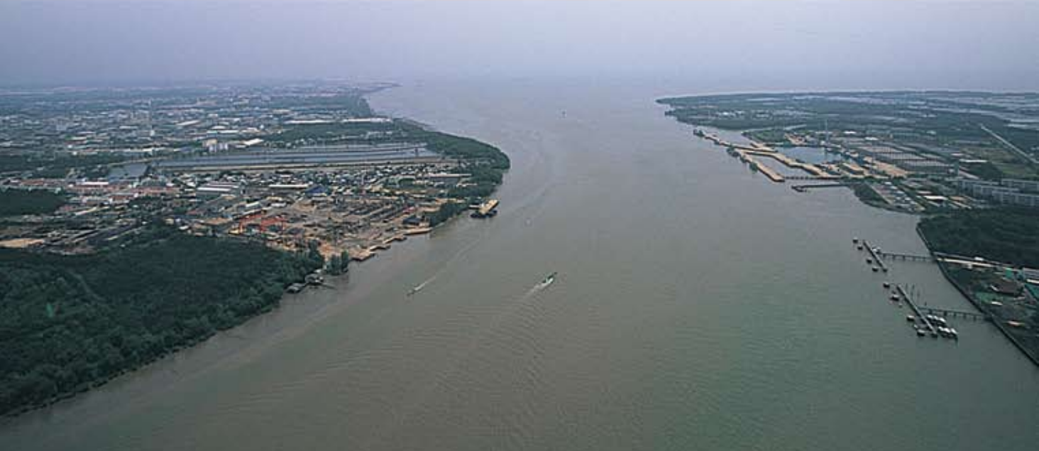
พิมพ์ที่ กองโรงพิมพ์ กรมสารบรรณทหารเรือ กันยายน ๒๕๕๓